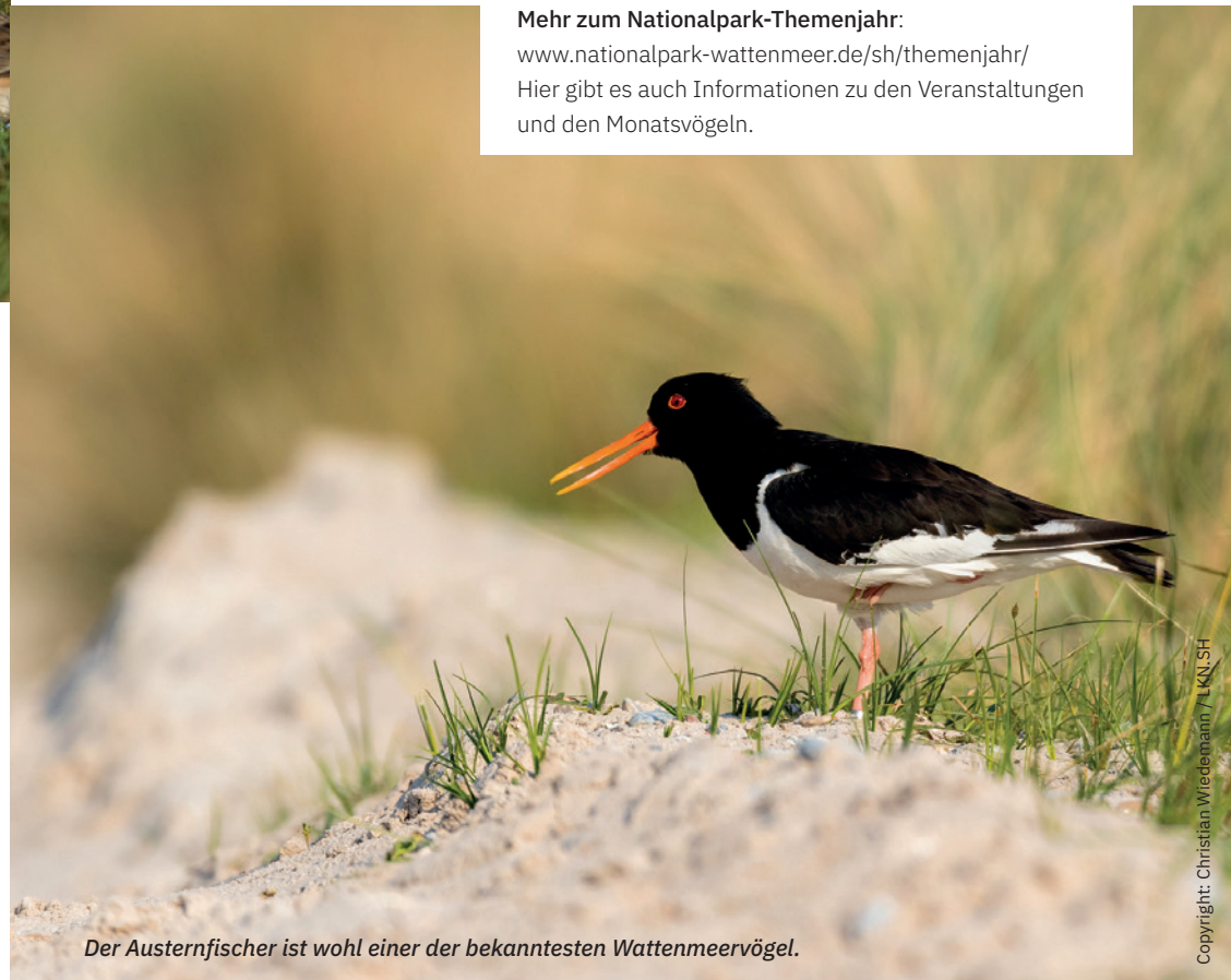
Der Austernfischer ist wohl einer der bekanntesten Wattenmeervögel.

Hier gibt es auch Informationen zu den Veranstaltungen und den Monatsvögeln.