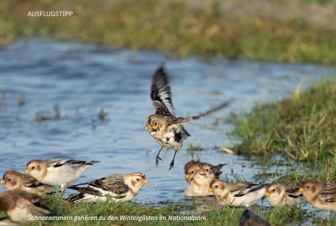
Schneeammern gehören zu den Wintergästen im Nationalpark.